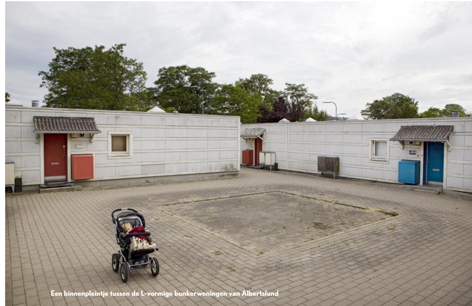
Een binnenpleintje tussen de L-vormige bunkerwoningen van Albertslund

De minimalistische bungalows vielen in de smaak bij jonge progressievelingen uit de krappe binnenstad van Kopenhagen. Met hun kleine kinderen verhuisden ze naar de fonkelnieuwe buurt, waar het zinderde van de socialistische, anarchistische en communistische idealen.